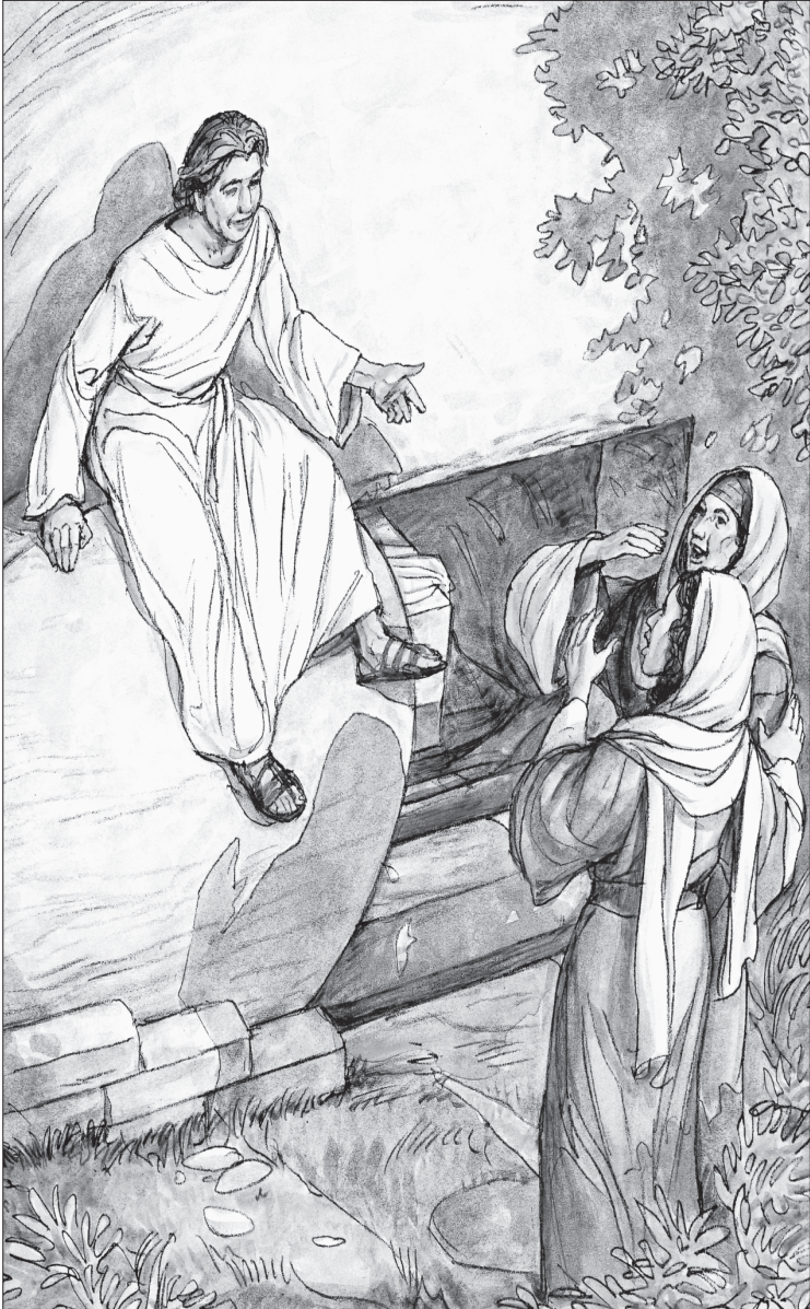
Sinabi ng anghel sa mga babae na si Jesus ay muling nabuhay.