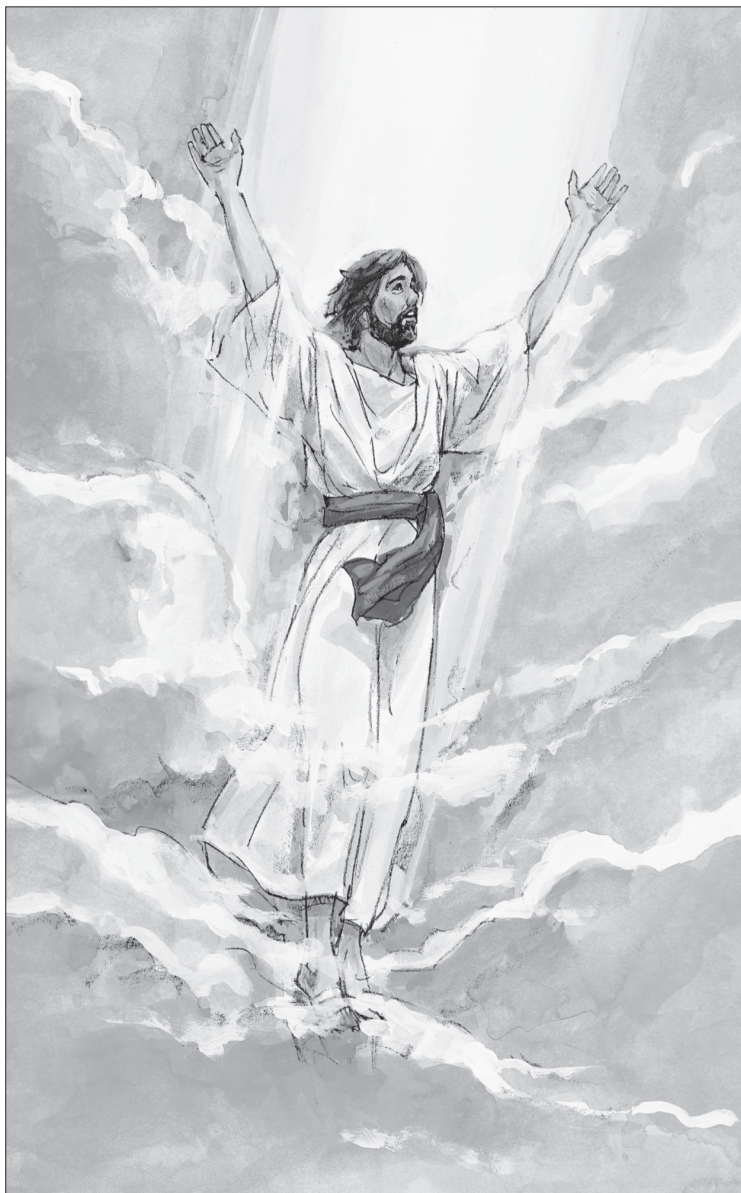
Muling nabuhay si Jesus at umakyat sa langit.