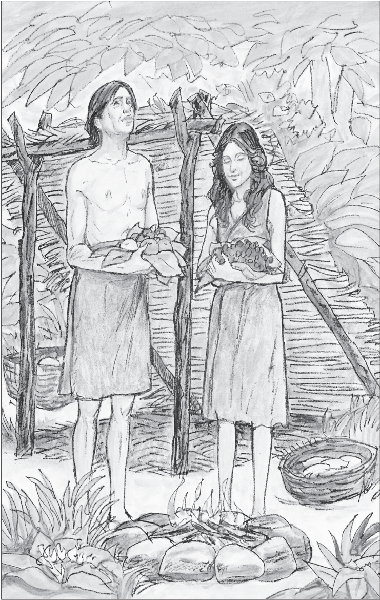
Binigyan ng Diyos sina Adan at Eva ng maraming kaloob.